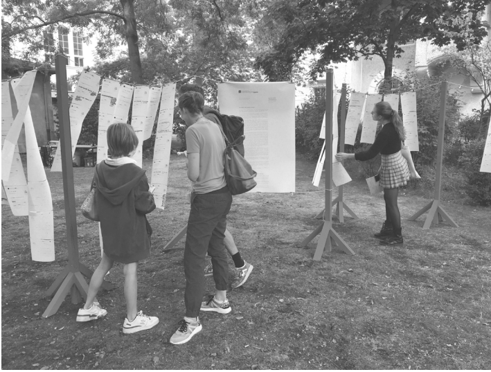
[Bild 8: Installation "Wir müssen Ihnen leider mitteilen, ..." während des UdK-Rundgangs im Juli 2022.]

gebäudes gab die Möglichkeit, mit unterschiedlichen Personen ins Gespräch zu kommen. Dabei wurde deutlich: Es gibt viele abgelehnte Bewerber*innen und immatrikulierte Studierende, die wütend sind und Redebedarf haben!