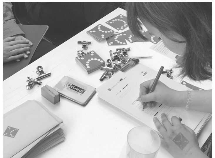
[Bild 7: Installation „Wir müssen Ihnen leider mitteilen, ...“ während des UdK-Rundgangs im Juli 2022. ]

Der Grundbaustein dieser Installation ist eine modifizierte Version des Ablehnungsbriefes der UdK, auf dem sonst die niederschmetternden Worte „die erforderliche künstlerische Eignung konnte nicht ausreichend festgestellt werden“ gestrichen und mit einer Leerstelle ersetzt wurden. An dieser Stelle luden wir Besucher*innen des Rundgangs ein, anonym Beobachtungen des Ausschlusses zu formulieren. Es wurden Erfahrungen bei den Aufnahmeverfahren beschrieben oder Analysen der Hochschulstrukturen und ihren Repräsentant*innen benannt. Die modifizierten Ablehnungsbriefe konnten anschließend an eine auf roten Holzstelen gespannte Leine aufgehängt werden.