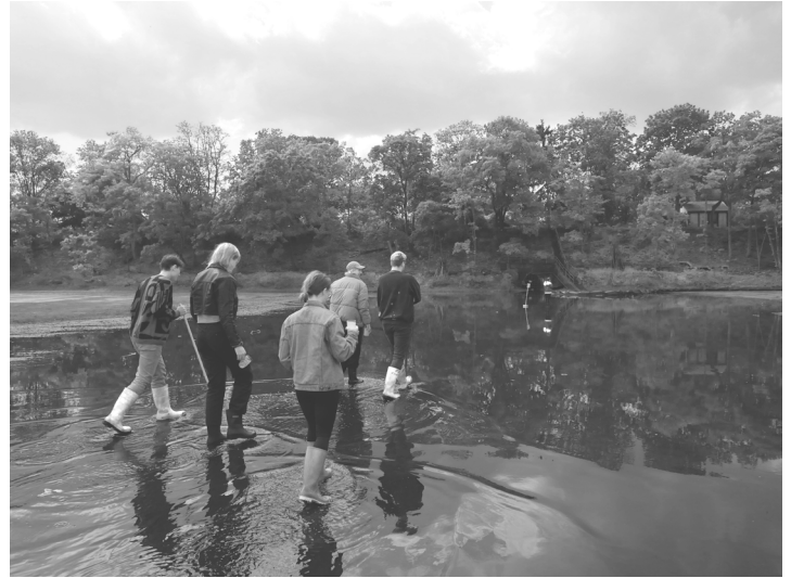
[Bild 5: Gummistiefelspaziergang mit Gesprächsfragen wie „Was hat dich gestern bewegt, überrascht, geärgert, irritiert?“ oder „Was möchtest du in die nächsten Seminartage mitnehmen?“ Foto: Eine Krise bekommen ]

mente auf dem Gelände, um den Teilnehmer*innen Rückzug und Freizeit zu ermöglichen. Wir haben zudem versucht, eine Teilnahme durch unterschiedliche Formen von Zuhören, Mitdiskutieren in kleinen und größeren Runden, für sich Schreiben, Lesen und Zeichnen zu ermöglichen.