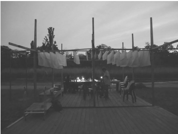
[Bild 4: Lockerer Einstieg in die Seminartage mit einem gemeinsamen Abendessen. Foto: Eine Krise bekommen ]

Kompliziertes Sprechen mit dem Ziel, Anerkennung zu bekommen, wurde beispielsweise mit Methoden wie dem ‚Language L‘ aufgebrochen. Mit der intervenierenden Handgeste in Form des Buchstabens L sollte in Gruppengesprächen von allen auf zu klärende Begriffe hingewiesen werden. So kann ein Raum für Nachfragen zu Unverständlichkeiten entstehen und das Finden einer verständlichen Sprache als gemeinsame Aufgabe begriffen werden – und nicht als Eigenverantwortung von einzelnen Personen. Aber auch andere gängige Verhaltensweisen aus universitären Räumen, wie etwa eine leistungsfähige Selbstinszenierung oder Namedropping , versuchten wir kollektiv zu reflektieren und zu verlernen.