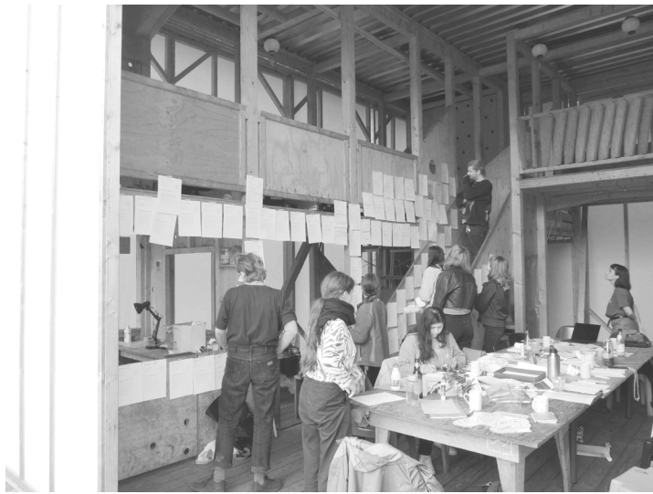
[Bild 6: Workshop während des Blockseminars. Foto: Eine Krise bekommen ]

der anderen Teilnehmer*innen zu wahren. Nach dem Seminar bemühten wir uns um eine Aufarbeitung, indem Nachgespräche geführt und aufgenommen wurden, um die Erfahrungswerte des Seminars in die zukünftigen Lernformate einzubringen.